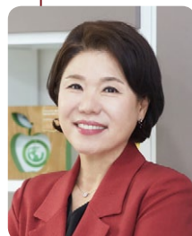
조은희 제21대 국회의원 <56기>

최고위정책과정에서만 느낄 수 있는 끈끈한 분위기가 있습니다. 과정을 마친 후에도 원우들과 지속적인 교류를 원하시는 분들께 추천합니다. 또한 풍부한 경험과 지식을 겸비하신 강사님들과의 질의문답 시간도 기억에 남습니다. 급변하는 행정환경과 글로벌 시대의 공공정책의 방향성에 대해서도 고민해 볼 수 있는 과정이라 생각합니다.